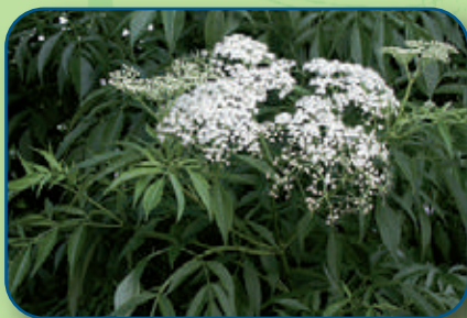
Sureau du Canada